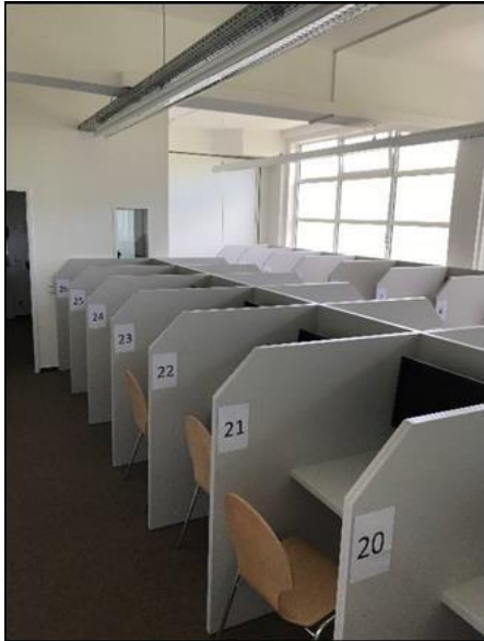
Probanden-Kabinen des Experimentallabors